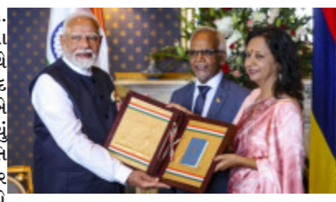
પીએમ મોદીને મોરેશિયસના વડાપ્રધાન નવીનચંદ્ર રામગુલામે મોરેશિયસનું સર્વોચ્ચ સન્માન 'ધ ગ્રાન્ડ કમાન્ડર ઓફ ધ ઓર્ડર ઓફ ધ સ્ટાર એન્ડ કી ઓફ ધ ઈન્ડિયન ઓશન' એનાયત કરવાની જાહેરાત કરી છે.

આપવાની રીતો પર ચર્ચા કરી.' આપને જણાવી દઈએ કે, મોદી ૧૦ વર્ષ પછી મોરેશિયસ પહોંચ્યા છે. આ પહેલા પીએમ મોદી માર્ચ ૨૦૧૫માં મોરેશિયસ ગયા આપવાની રીતો પર ચર્ચા કરી. મોરેશિયસની દઈએ કે, મોદી ૧૦ વર્ષ પછી મોરેશિયસ પહોંચ્યા છે. આ પહેલા પીએમ મોદી માર્ચ ૨૦૧૫માં મોરેશિયસ ગયા