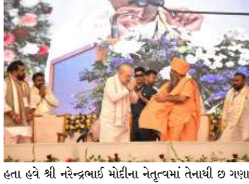
હતા હવે શ્રી નરેન્દ્રભાઈ મોદીના નેતૃત્વમાં તેનાથી છ ગણ વધારે ૧,૩૭,૦૦૦ કરોડ અને ૨૫ લાખ કરોડ ખેડૂતોને લોનમાટે આપવામાં આવ્યા છે તેમ પણ જણાવ્યું હતું.

જૂનાગઢ તા.૮ કેન્દ્રીય ગૃહ અને સહકારિતા મંત્રી શ્રી અમિતભાઈ શાહના હસ્તે આજે જૂનાગઢ જિલ્લાના ચાપરાડ સ્થિત બ્રહ્માનંદ વિદ્યાધામ ખાતે શ્રી મુક્તાનંદ બાપુની પ્રેરક ઉપસ્થિતિમાં સૈનિક સ્કૂલ શાળા બિલ્ડિંગ, સૈનિક સ્કૂલ સ્ટોક ક્વાર્ટર ભવન, જ્ય અંગે હોસ્પિટલ ડોક્ટર ક્વાર્ટર બિલ્ડિંગ, જ્ય અંગે હોસ્પિટલ મોડ્યુલર ઓપરેશન થિયેટર કોમ્પ્લેક્સ અને બ્રહ્માનંદ વિદ્યાધામ અતિથિ ભવનનું લોકાર્પણ તેમજ પૂજ્ય મુક્તાનંદ બાપુ મેડિકલ કોલેજ એન્ડ રિસર્ચ ઇન્સ્ટિટ્યૂટ, શ્રી બ્રહ્માનંદ વિદ્યાધામ સંસ્કૃત શક્તિ ગુરુકુળનું ખાતમુહૂર્ત કરવામાં આવ્યું હતું.