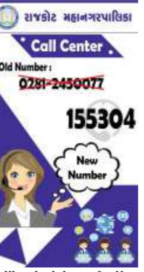
ઇન્ફોર્મેશન ટેકનોલોજીના ડીપાર્ટમેન્ટ ઓફ ટેલીકોમ્યુનિકેશન દ્વારા ભારતની

રાજકોટ, તા.૮ રાજકોટ મનપા દ્વારા મનપાની વિવિધ સેવાઓને લગત નાગરિકોની ફરિયાદોની નોંધણી માટે વર્ષ ૨૦૦૮ થી અમીન માર્ગ ખાતે ૨૪x૭ કોલ સેન્ટર ચાલુ કરવામાં આવેલ છે. જેમાં વાર્ષિક ૩.૭૫ લાખ ફરિયાદો નોંધવામાં આવે છે. આ માટે મનપા દ્વારા લેન્ડ લાઈન નં. ૦૨૮૧-૨૪૫૦૦૭૭ કે જેમાં ૦૫ હર્ડેઈ લાઈન સામેલ છે. તેમજ ટોલ ફ્રી નં. ૧૮૦૦-૧૨૩-૧૯૭૩ પર શહેરના નાગરિકો ફોન દ્વારા ૨૪ કલાકની મનપાની સેવાઓ અંગે ફરિયાદો નોંધાવી શકે છે તે પ્રકારની વ્યવસ્થા અમલમાં મુકેલ છે. ભારત સરકારના મીનીસ્ટ્રી ઓફ કોમ્યુનિકેશન એન્ડ