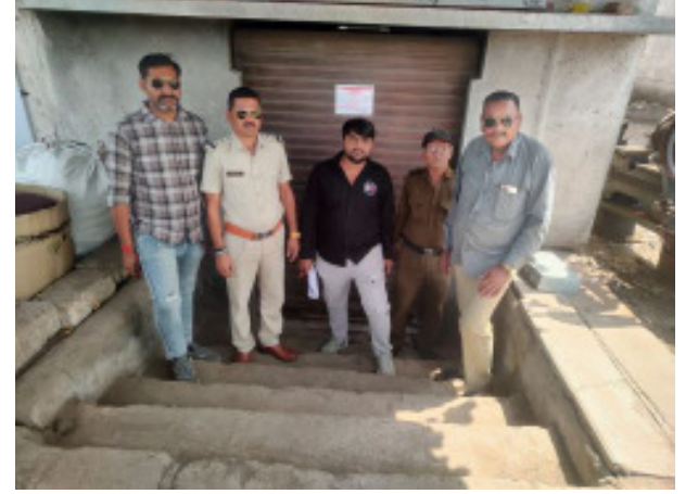
રાજકોટ, તા.૩ રાજકોટ મનપાના કમિશ્નરની