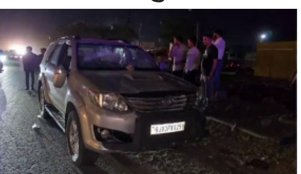
ફિકેટ રમવા જતા હતા કાર ફરિયાદી પાથ ચલાવતો હતો અને ઉમિયા સર્કલથી દલવાડી સર્કલ ચાર રસ્તા પહોંચતા રોડ પર બુલેટ આગળ જતું હતું અને રોડ કોસ કરવા માટે ઉભા હતા ત્યારે આગળનો ભાગ બુલેટના પાછળના ભાગે અડી જતા બુલેટ ચાલક અને તેની પાછળ બેસેલ ઈસમ બોલાચાલી અને ઝઘડો કરવા લાગ્યા હતા ગાડી સાઈડમાં ઉભી રાખી બુલેટમાં થયેલ નુકશાની બાબતે વાતચીત કરી હતી અને નુકશાનીના રૂપિયા દશથી પંદર હજાર આપવા

દલવાડી સર્કલ નજીક આગળ જતા બુલેટને પાછળ આવતી ફોર્સ્યુનર કાર ભલ્લી અડી જતા અકસ્માત સર્ભ થયો હતો જે અકસ્માત બાદ બુલેટના ચાલક સહિતના ચાર ઈસમોએ ઝઘડો કરી કારમાં ધોકા મારી નુકશાન કર્યાની પોલીસે ફરિયાદ નોંધાઈ છે.