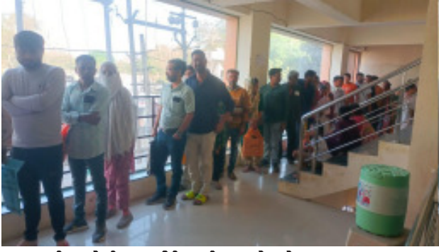
બીજું લોગીન આઈડી મળી ગયું છે, ટોકન સંખ્યા વધારવામાં આવશે : મ્યુનીસીપલ કમિશ્નર

મોરબીને મહાનગરપાલિકા બનાવ્યા બાદ પણ લોકોની તકલીફ ઘટવાનું નામ નથી લઈ રહી આજે પણ જન્મ અને મરણના દાખલા કઢાવવા માટે વહેલી સવારથી લાઈનો લાઈનો બેવા મળી હતી અને નાગરિકોને જન્મ-મરણ દાખલા જેવા કામ માટે કલાકોનો સમય વેડવો પડી રહ્યો છે જેથી રોષ ભલ્લી રહ્યો છે.